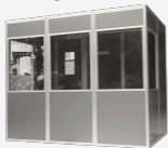
Kan utvides til en TRIO